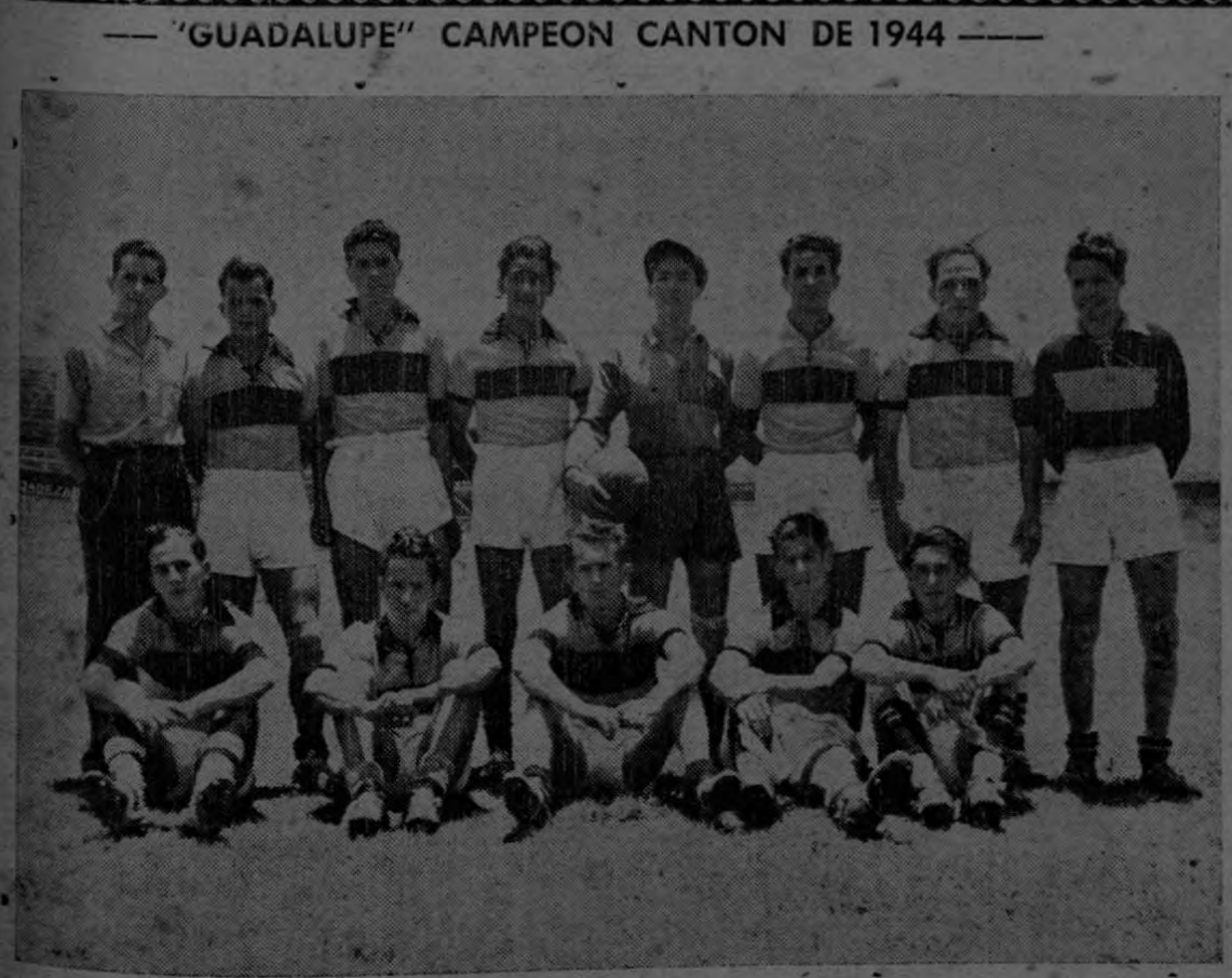
He aquí querido lector, a los integrantes del Club Sport Guadalupe, Campeón Cantonal de 1944. De izquierda a Derecha, de pie: